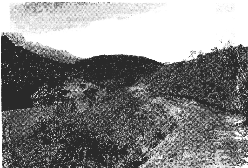
Foto 1. Zonas anegadas del municipio de Rangel