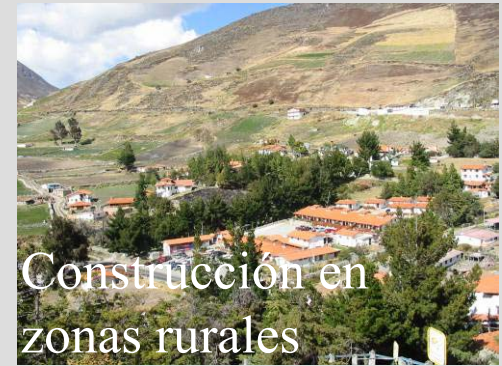
Construcción en zonas rurales