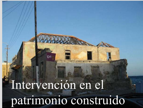
Intervención en el patrimonio construido